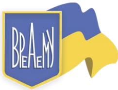
ВГО "Вища рада енергоаудиторів та енергоменеджерів України"